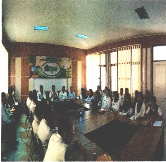
FOTO KEGIATAN RAPAT EVALUASI PELAKSANAAN PROGRAM DAN KEGIATAN TRIWULAN III TAHUN 2023