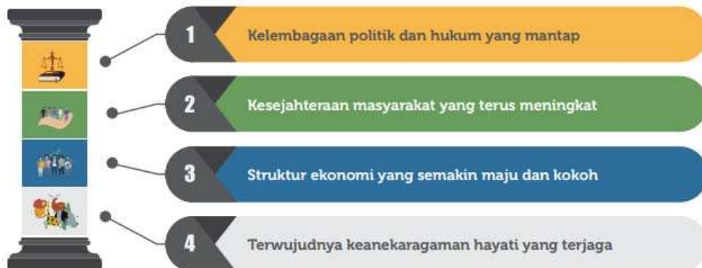
Gambar 3.1 Empat Pilar RPJMN 2020-2024