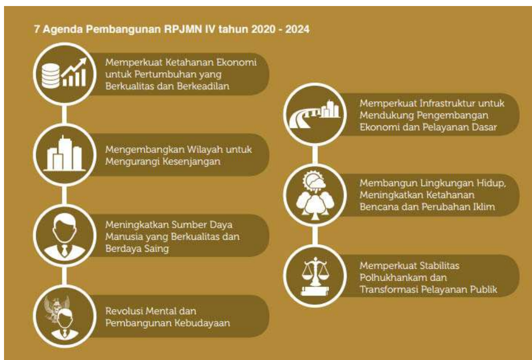
Gambar 3.2 7 Agenda Pembangunan RPJMN IV Tahun 2020-2024

Saat ini dunia telah memasuki era revolusi industri 4.0. Revolusi tersebut memberikan tantangan dan peluang bagi perkembangan perekonomian ke depan. Di satu sisi, digitalisasi, otomatisasi, dan penggunaan kecerdasan buatan dalam aktivitas ekonomi akan meningkatkan produktivitas dan efisiensi dalam